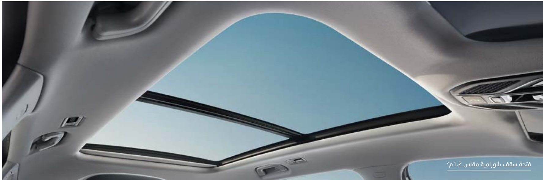
فتحة سقف بانورامية مقاس 1.2م 2