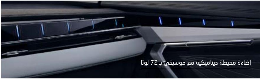
إضاءة محيطية ديناميكية مع موسيقى بـ 72 لوتًا