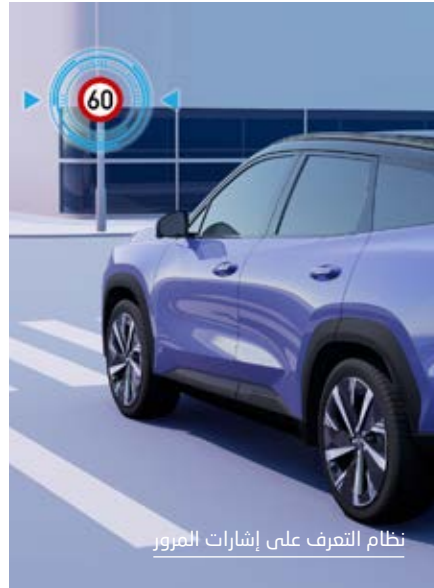
نظام التعرف على إشارات المرور