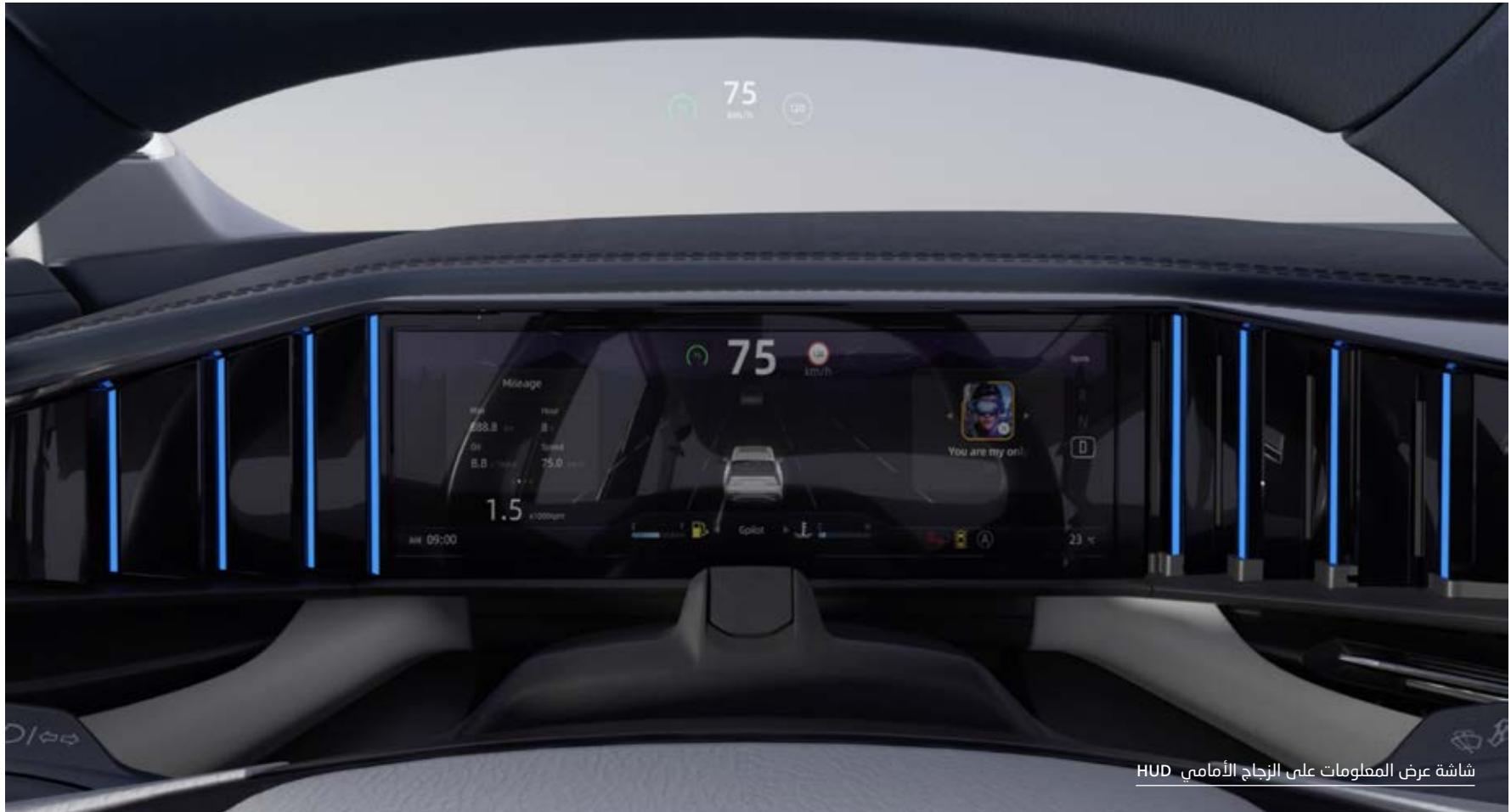
شاشة عرض المعلومات على الزجاج الأمامي HUD