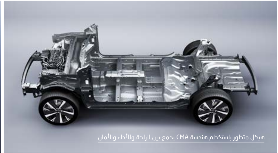
هيكـل متطور باستخدام هندسة CMA يجمع بين الراحة والأداء والأمان