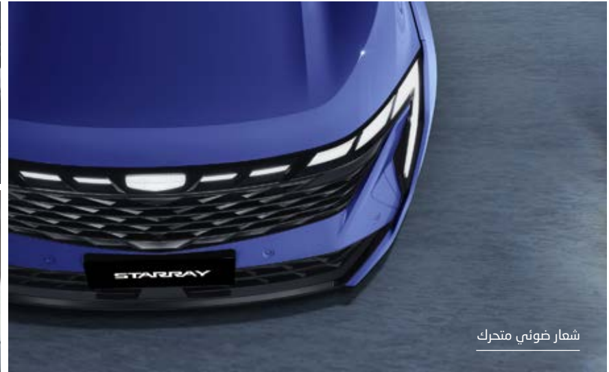
شعار ضوئي متحرك