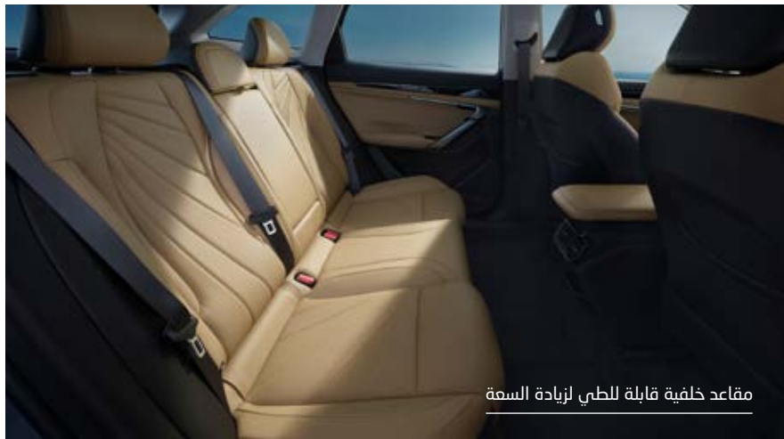
مقاعد خلفية قابلة للطي لزيادة السعة