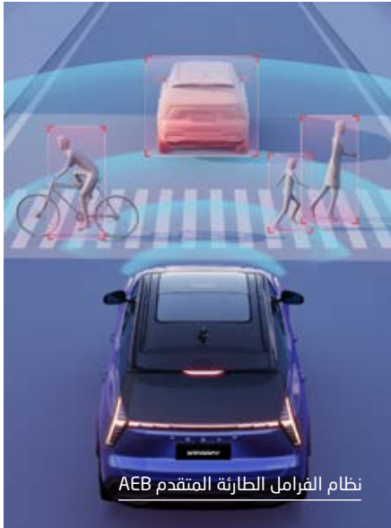
نظام الفرامل الطارئة المتقدم AEB