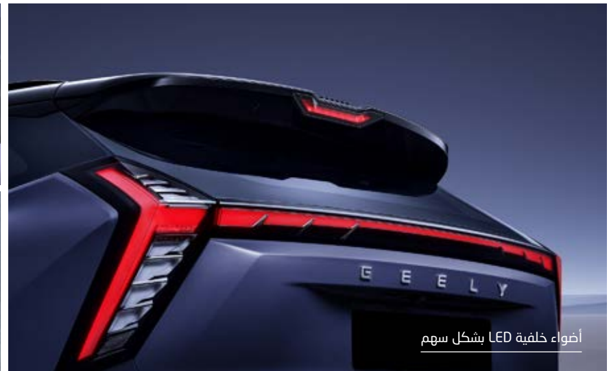
أضواء خلفية LED بشكل سهم