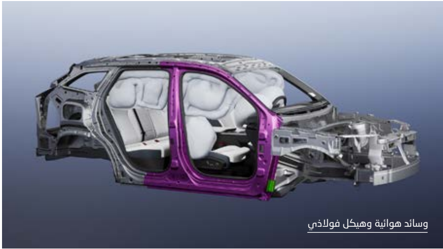
وسائد هوائية وهيكـل فولاذي