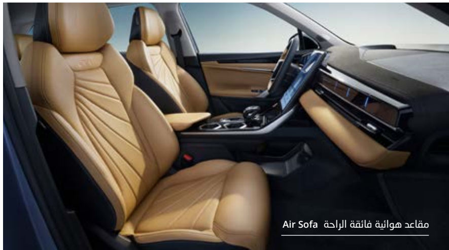
مقاعد هوائية فائقة الراحة Air Sofa