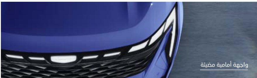
واجهة أمامية مضيئة