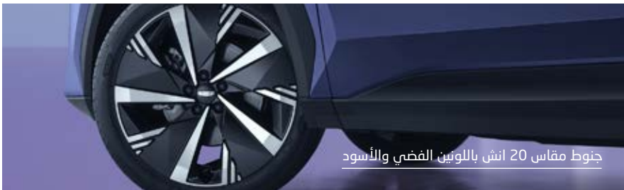
جنوط مقاس 20 انش باللونين الفضي والأسود