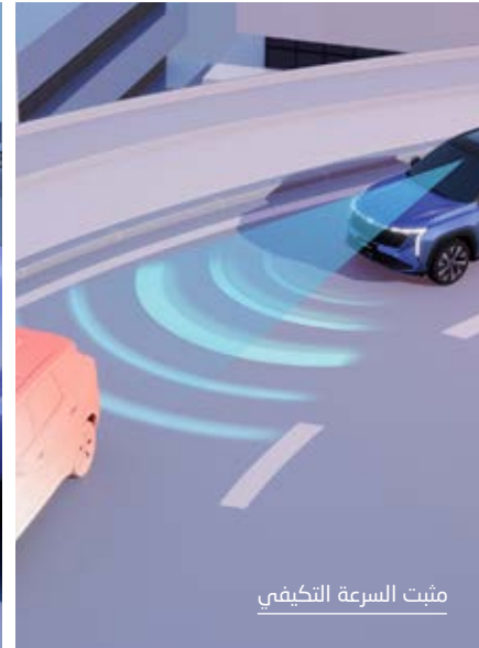
مثبت السرعة التكيفي