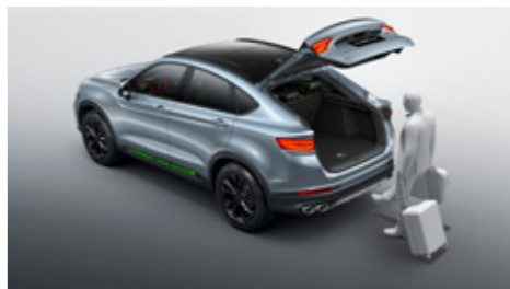
باب خلفي أوتوماتيكي يعمل دون لمس