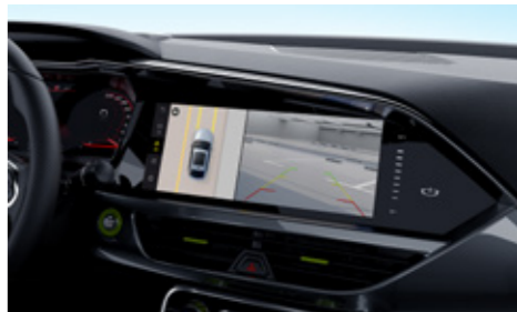
كاميرا 360 درجة