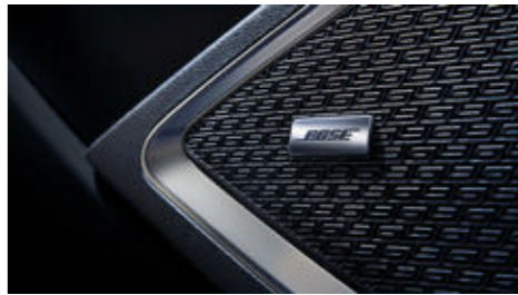
نظام صوت من بوز