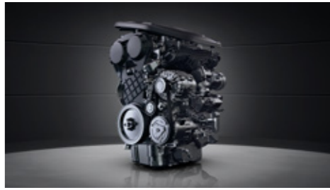
محرك حقن 2.0 + ناقل حركة عالية الأداء 8 سرعات