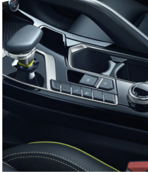
ناقل حركة بتصميم مستوحى من الطائرة النفاثة