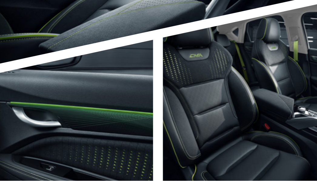
جلد صناعي من البولبي يورثين