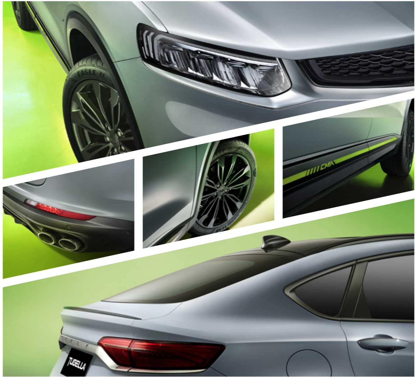
تصميم كوبيه ذو سقف مائل بزواية 14°