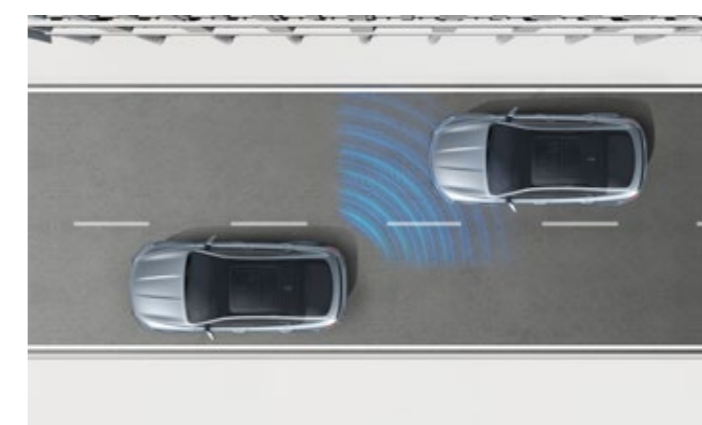
نظام كشف النقاط العمياء BSD