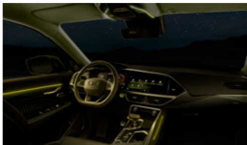
أنوار محيطية بـ 8 ألوان