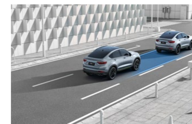
نظام السرعة المتكيف ACC